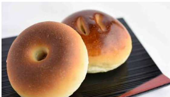
Sakadane Sakura Anpan