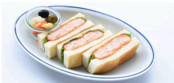
Original Shrimp Sandwich