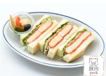
Pork cutlet Sandwich ポークカツサンド