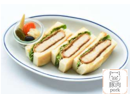
Miso Pork cutlet Sandwich 味噌カツサンド