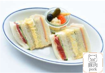
Mixed Sandwich ミックスサンド