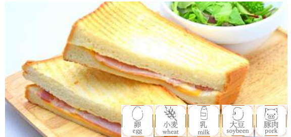
Ham & cheese toast w/Beverage