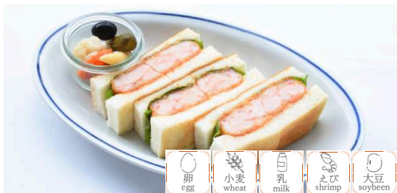
Original Shrimp Sandwich w/Beverage