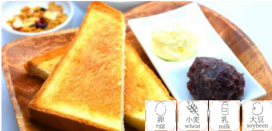
Ogura toast set w/Beverage