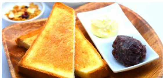
Ogura toast set