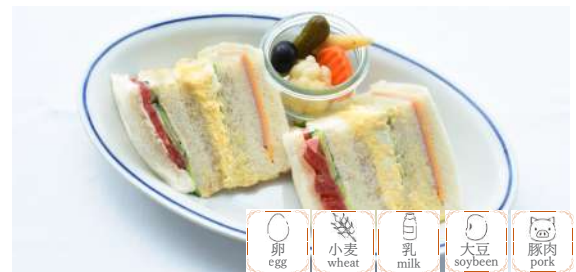
Mixed Sandwich w/Beverage