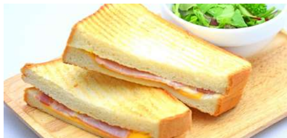
Ham & cheese toast