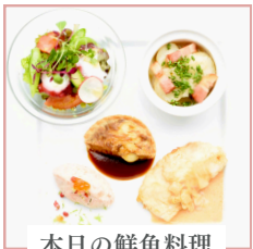
本日の鮮魚料理 3,600円(税込)