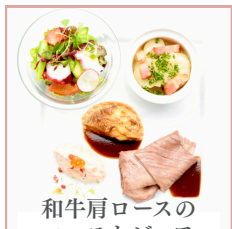
和牛肩ロースの ローストビーフ 3,600円 (税込)