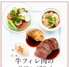
牛フィレ肉の ポワレ(60g) 4,100円 (税込)